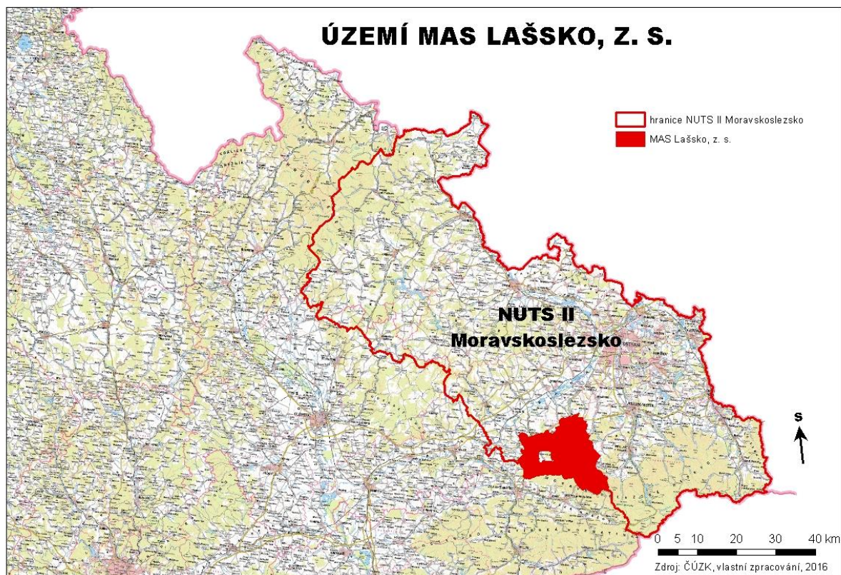
Obr. 1 Vymezení území MAS Laško, z. s. v rámci NUTS 2 a NUTS 3.

Následující mapy znázorňují území Místní akční skupiny Laško z.s, a také vymezení území v rámci NUTS 2 a NUTS 3. NUTS 2 Region soudružnosti Moravskoslezsko, na jehož území působí Místní akční skupina z.s., svým vymezením odpovídá území NUTS 3 tedy území Moravskoslezského kraje.